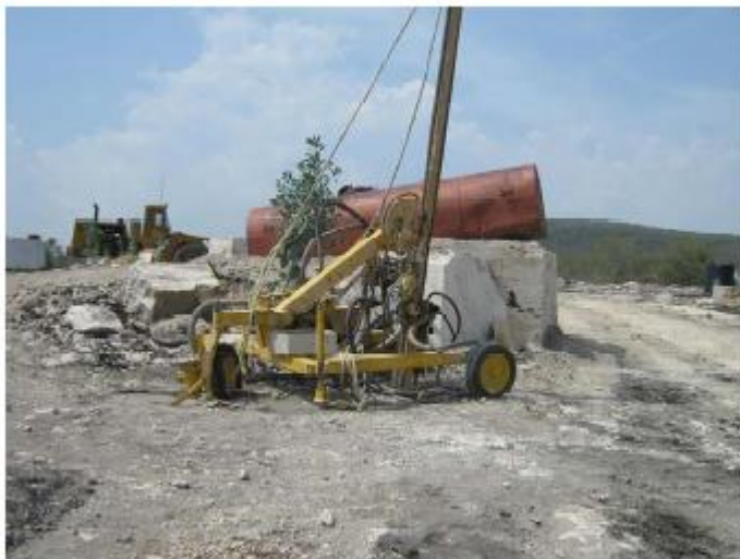
Equipo de hilo diamantado utilizado para la explotación de caliza marmolizada.