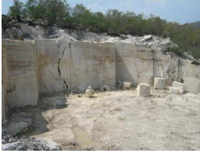
Banco de caliza marmolizada de color blanco a gris claro, con óxidos de hierro en fracturas.