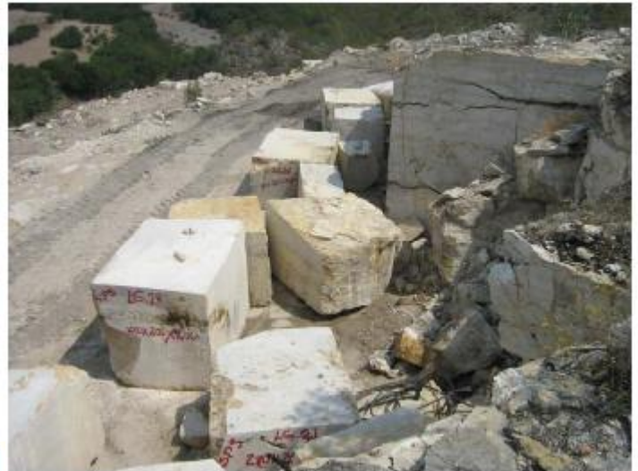
Bloques cortados y marcados para su transportación y comercialización.